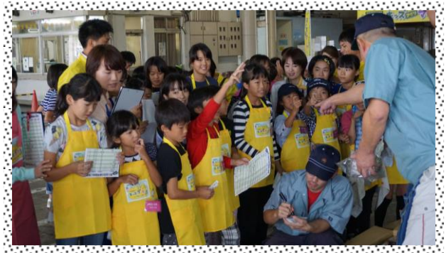
《 競り風景 》