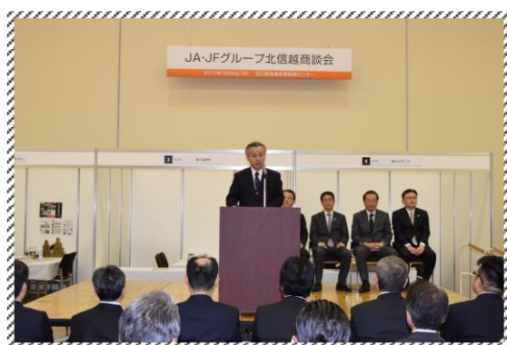
《 開会挨拶 》