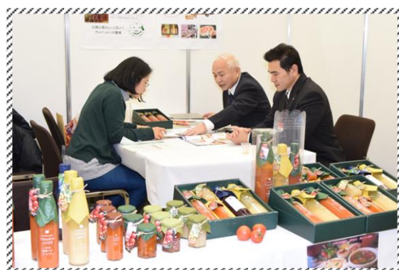
《 商談風景 》