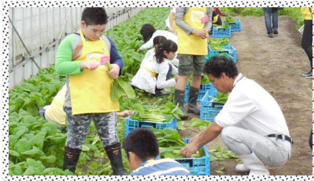
《 収穫風景 》