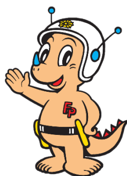
福井県警マスコット リュウピー